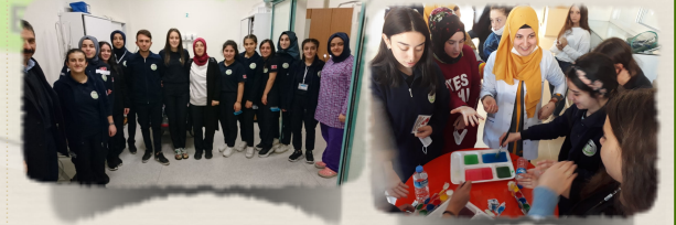
Staj eğitimi hastahane, toplum sağlığı merkezlerinde yapılabilmektedir.