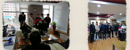
Staj eğitimi devlet dairelerinde ya da özel kurumlarda yapılabilmektedir