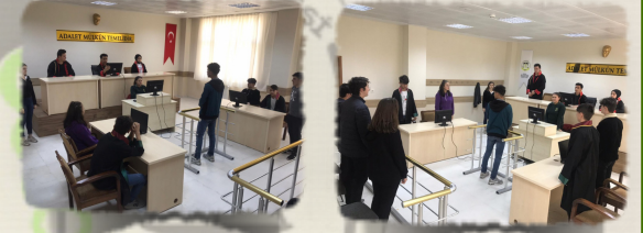
Staj eğitimi adliyede, hukuk bürolarında yapılabilmektedir.

Okulumuzda BİLGİSAYARLI MUHASEBE dalı bulunmaktadır